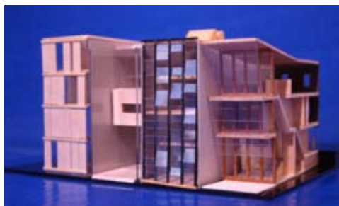
particuliere opdrachtgever, Borneo-Sporenburg