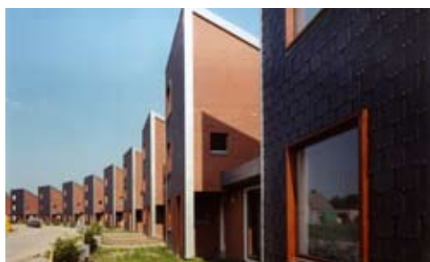
10 twee-onder-eenkapwoningen, Haaften