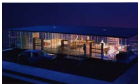
Glazen huis, Leerdam