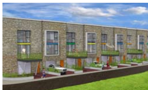
72 koopwoningen, Arnhem