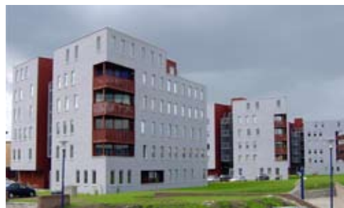
herontwikkeling PTDSN-terrein, Hilversum