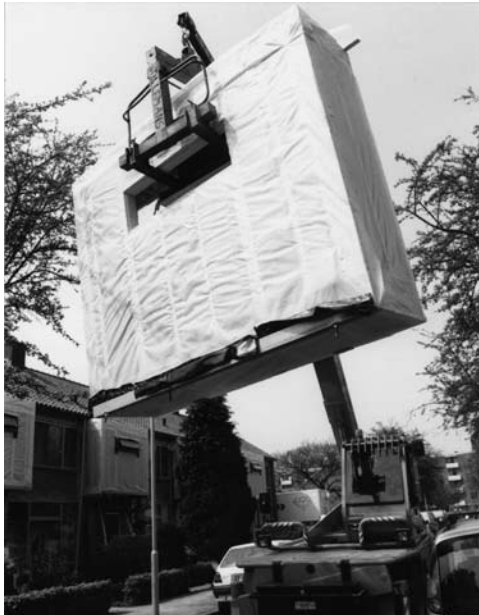
montage prefab uitbouw