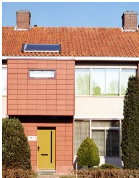
nieuwe entree met geïntegreerde verlichting, huisnummer, bel