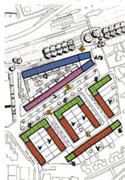
de verschillende woon werk milieus