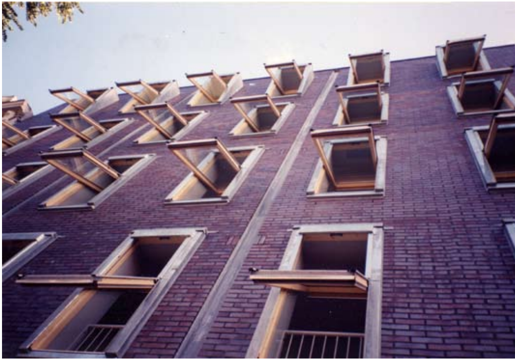
Symphonie van Velux vensters