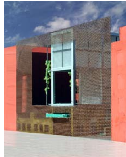
straatgevel nieuwe situatie